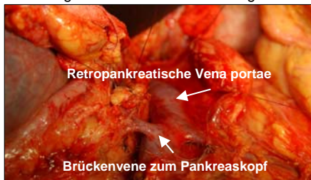
Abbildung 1: Pankreasdurchtrennung